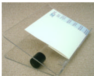
CODE : EDHCH1000